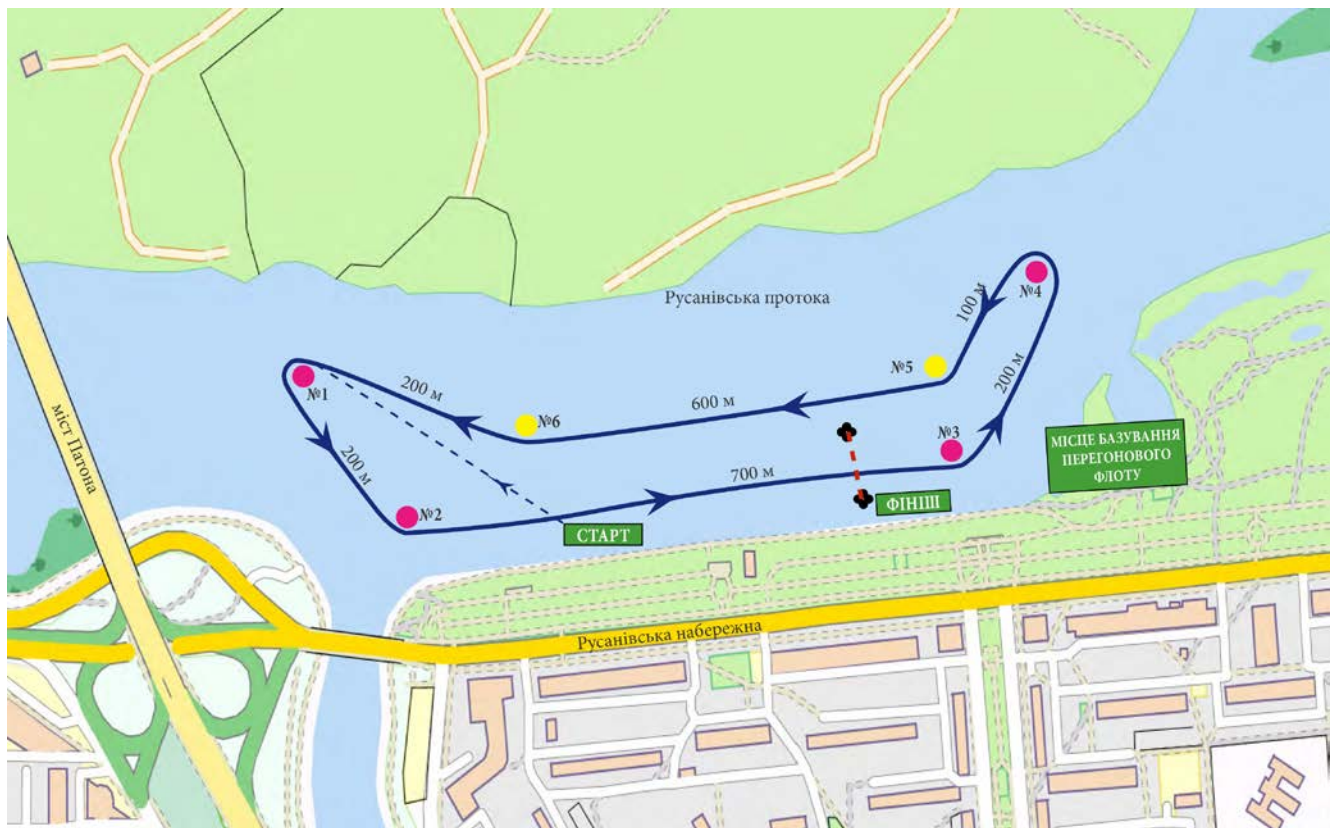
Схема траси змагання